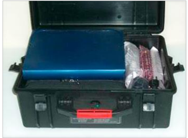
Тара для транспортировки — герметичный ударопрочный кейс