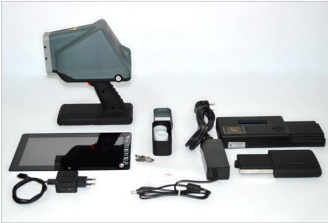
Комплект ПРФА «МетЭксперт»