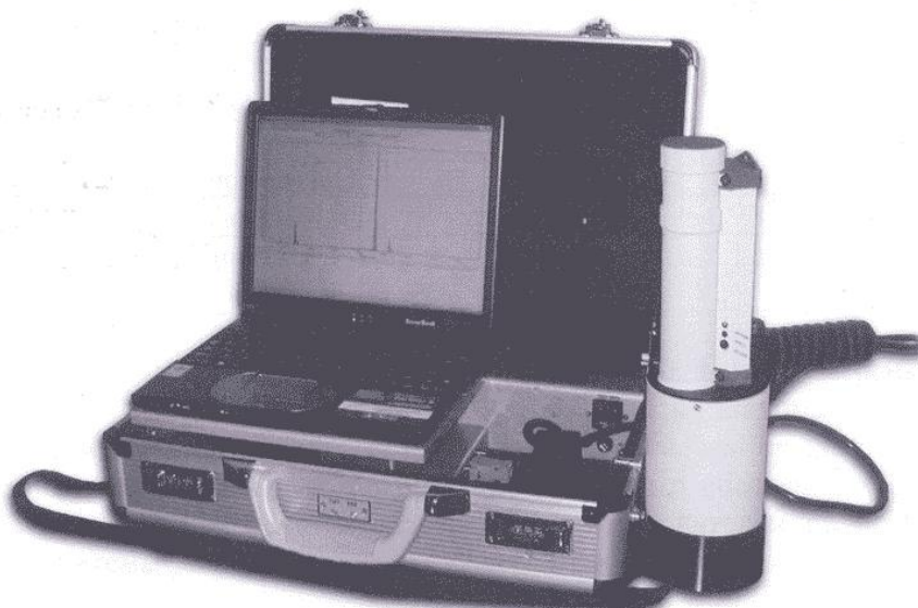
Рисунок 1 - Внешний вид анализатора «Призма - М(Au)» в переносном исполнении

Внешний вид анализатора «Призма - М(Au)» представлен на рисунках 1 и 2.